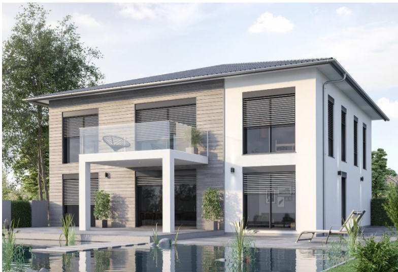
Bild 1: Mit dem Raff-E hat Alukon einen Schnellbaukasten für Raffstoren entwickelt, der sich vor allem durch Montagefreundlichkeit und flexible Baugrößen auszeichnet.